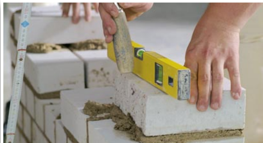
Falk-Torben Handt Ansprechpartner Überbetriebliche Ausbildung

»Erfolg entsteht aus Leidenschaft. Auszubildende können durch Einsatz und Willen ihre Zukunft mitgestalten. Eine Erfolgsgeschichte, die mit dem Gesellenbrief belohnt wird«